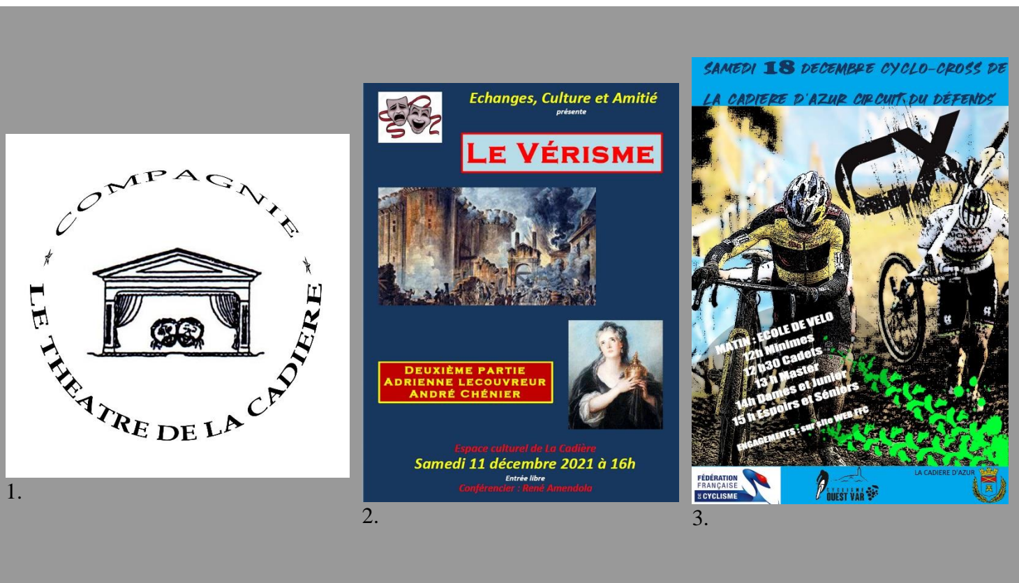
1. Festival de Théâtre les 4-5/12 ; 2. Conférence sur le Vérisme 11/12 ; 3. Cyclo Cross 18/12